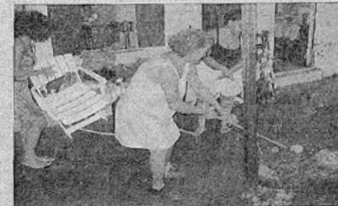
Tout le monde met du cœur à l'ouvrage pour faire disparaître les traces de l'inondation.

Mardi, depuis 5 heures du matin, on avait de la boue et de l'eau dans la maison, partout ! Au moins un mètre d'eau. Ch. que fois qu'il y a de fortes pluies, un débordement comme ça, c'est pareil. Je perds mes meubles. Là, on a réussi à les sauver, en les mettant en hauteur. Mais on a déjà perdu deux salons ici ! La mairie ne fait rien, ne dit rien. Cela fait 34 ans qu'on habite ici, il n'y a jamais rien eu. Même si on va prévenir la mairie, à quoi ça sert ? Ça fait 34 ans que j'entends qu'on va nous reloger, mais on est toujours là. C'est inadmissible que chaque fois qu'il pleut, on se retrouve dans cette situation. Et, heureusement que ce n'était pas un cyclone, sinon on n'aurait plus de toit. Dean est passé, Dean a découvert la maison et j'ai dû réparer moi-même. Où était la mairie ? Où était le propriétaire de la maison ? Personne ne te propose ne serait-ce qu'une feuille de tôle ! L. V. ■