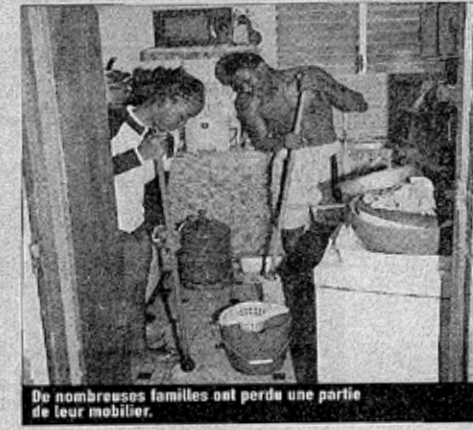
De nombreuses familles ont perdu une partie de leur mobilier.