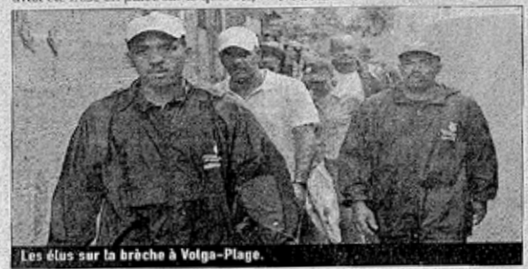
Les élus sur la brèche à Volga-Plage.

avec du personnel municipal, notamment des assistantes sociales du CCAS, pour recevoir les personnes concernées par les intempéries et trouver des solutions de logement pour celles qui se trouvent dans le besoin. J.-M. AL ■